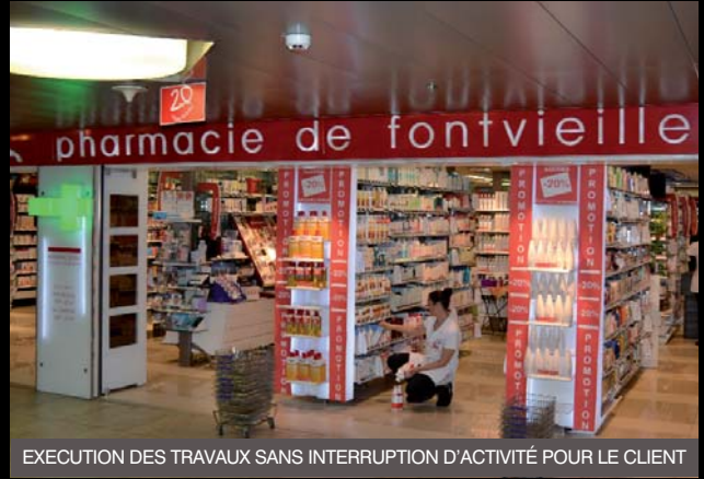
EXECUTION DES TRAVAUX SANS INTERRUPTION D'ACTIVITÉ POUR LE CLIENT

Grâce à nos facultés d'adaptation, nous avons aujourd'hui une clientèle très variée : Particuliers, boutiques/commerces, industries, tertiaire, administrations, agences immobilières & syndicats d'immeubles, etc.