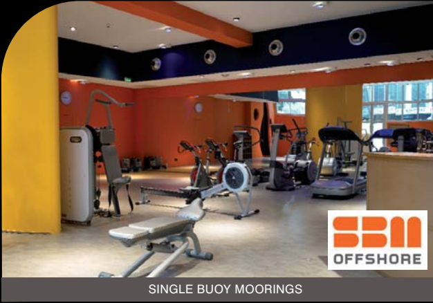
SINGLE BUOY MOORINGS

Grâce à nos facultés d'adaptation, nous avons aujourd'hui une clientèle très variée : Particuliers, boutiques/commerces, industries, tertiaire, administrations, agences immobilières & syndicats d'immeubles, etc.